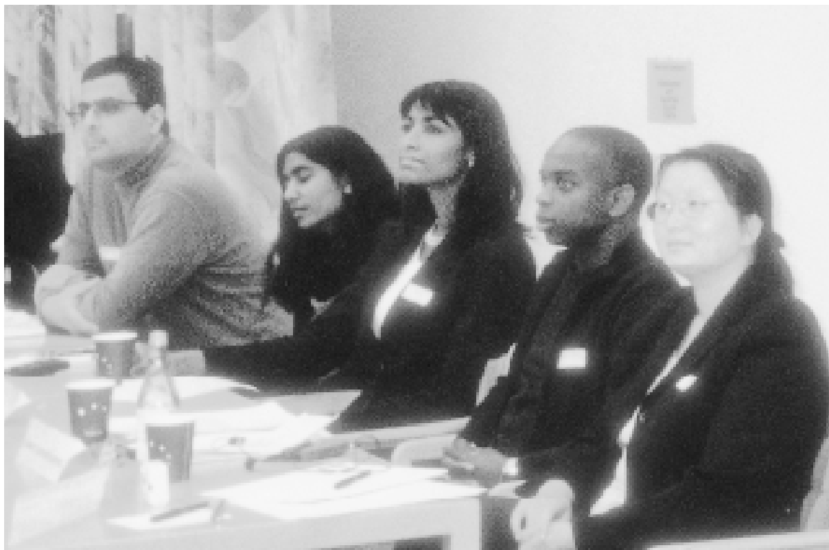
Nordiskt adopterade med synpunkter på framtida forskningsbehov.