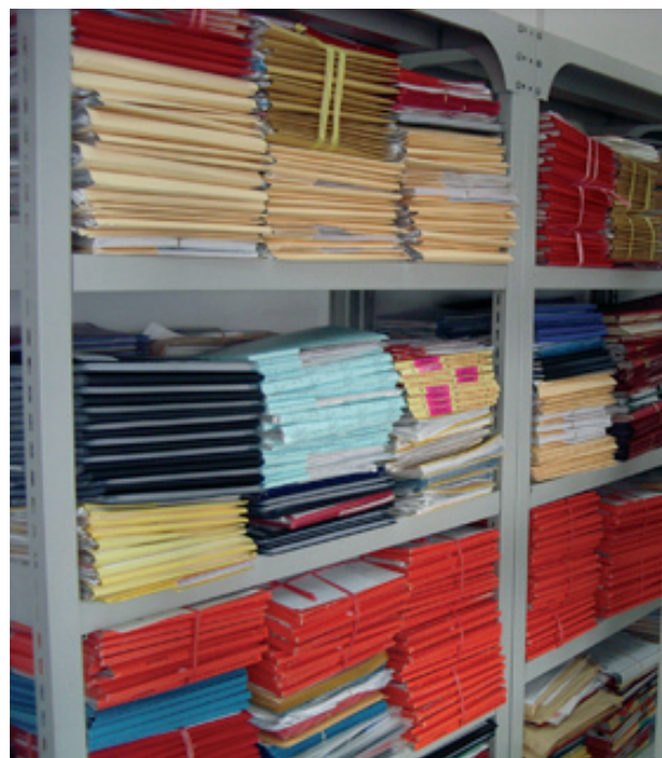
Adoptionsansökningar hos CCAA

Länk till CCAA:s brev med de nya kraven Länk till adoptionsorganisationernas sammanfattning av mötet på CCAA den 15 mars 2007. För aktuell information angående ansökningar till Kina se webbadresser till Adoptionscentrum, BV och FFIA.